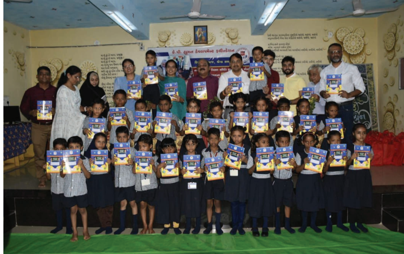
લર્નિંગ બુક સાથે વિદ્યાર્થીઓની સમૂહ તસ્વીર

આ પ્રસંગે કે.પી. હુમન ડેવલપમેન્ટ ફાઉન્ડેશનના ડાયરેક્ટર રાજા શેખે જણાવ્યું હતું કે, વિદ્વાન અને શિક્ષિત લોકોએ સમાજમાં નૈતિક મૂલ્યો સ્થાપિત કરવા શિક્ષણને મહત્વનું પાસુ ગણાવ્યું છે. માનવ સમાજમાં જીવનઘોરણ ઊંચું લાવવા અને સામાજિક જવાબદારીઓ માટે સભાનતા ત્યારે જ આવી શકે જ્યારે શિક્ષણ અને શિક્ષણ થકી સમજણ કેળવાય. સુંદર અને આદર્શ જીવન જીવવા માટે 'શિક્ષણ'નો વિસ્તાર ખૂબ જરૂરી છે. રાજ્ય સરકારે પણ નાની વયે જ બાળકોને માનુષ્યા ગુજરાતીની સાથે હિન્દી-અંગ્રેજીનું સામાન્ય જ્ઞાન પણ આપવું જરૂરી ગણાવ્યું છે. વધુમાં તેમણે કહ્યું હતું કે, બાળમંદિરથી લઈ એન્જિનિયર, ડોક્ટર, વકીલ તેમજ આઈપીએસ સુધીની વિશેષ કિડી મેળવવા દરેકતા બાળકોને પણ તેઓ દત્તક લઈ જરૂરી સવલતો પૂરી કરી રહ્યા છે. સુરતના કે.પી. ચુપ હેડળ ચાલતા કે.પી. હુમન ડેવલપમેન્ટ ફાઉન્ડેશન દ્વારા દત્તક લેવાથી સુરત પાલિકા સંચાલિત શિક્ષણ સમિતિની શાળા ક્રમાંક-૧૦૫ અને ૧૪૯ (દિવાળી બાગ)માં આ આત્યાસક્રમ શરૂ કરાવી તે સંબંધિત બુકનું નિ:શુલ્ક વિતરણ કરવામાં આવ્યું હતું.