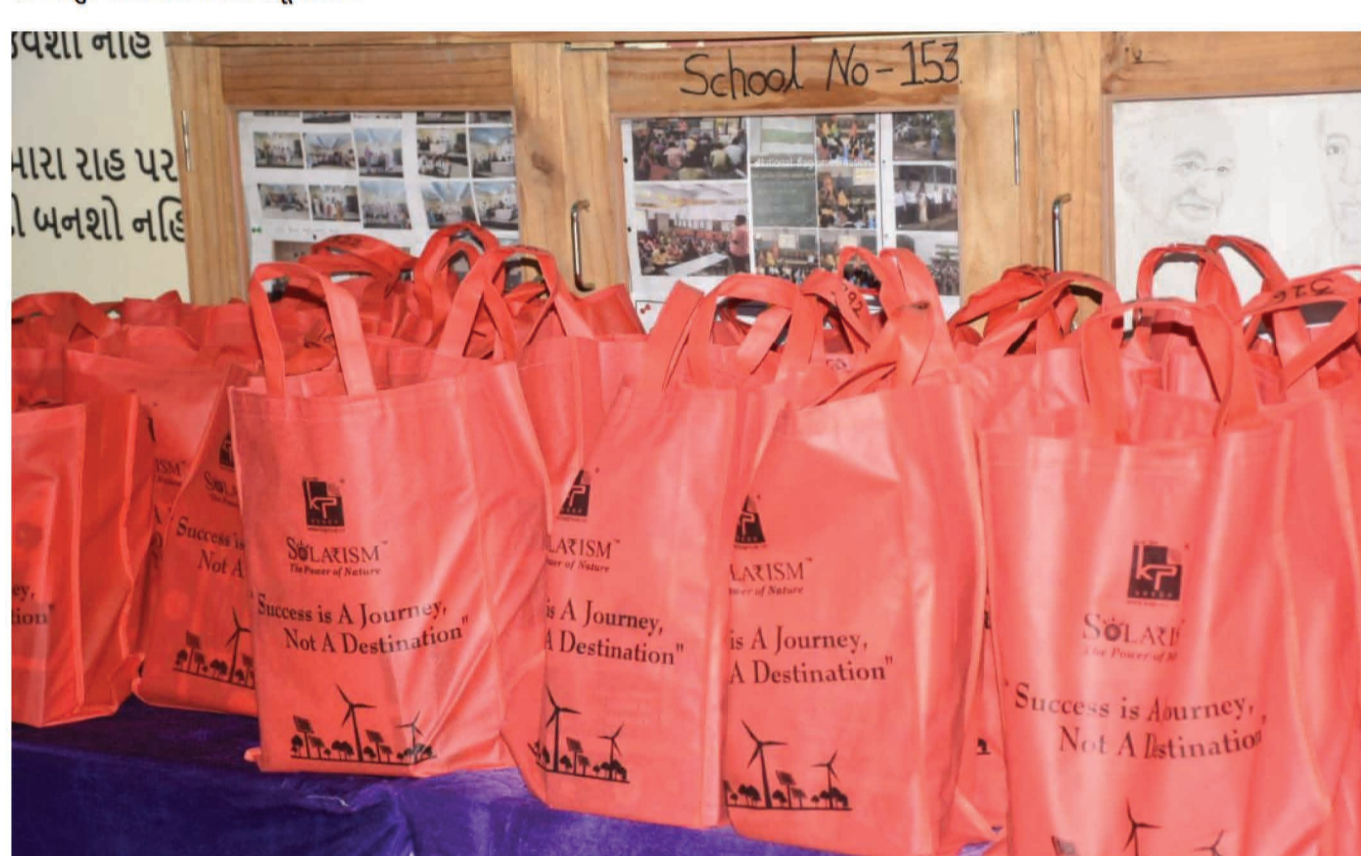
ભૂલકાંઓ અંગ્રેજી-હિન્દીનું સારુ શિક્ષણ મળે તેવો ઉમદા આશય આ લર્નિંગ બુકના વિતરણ પાછળ રખાયો છે